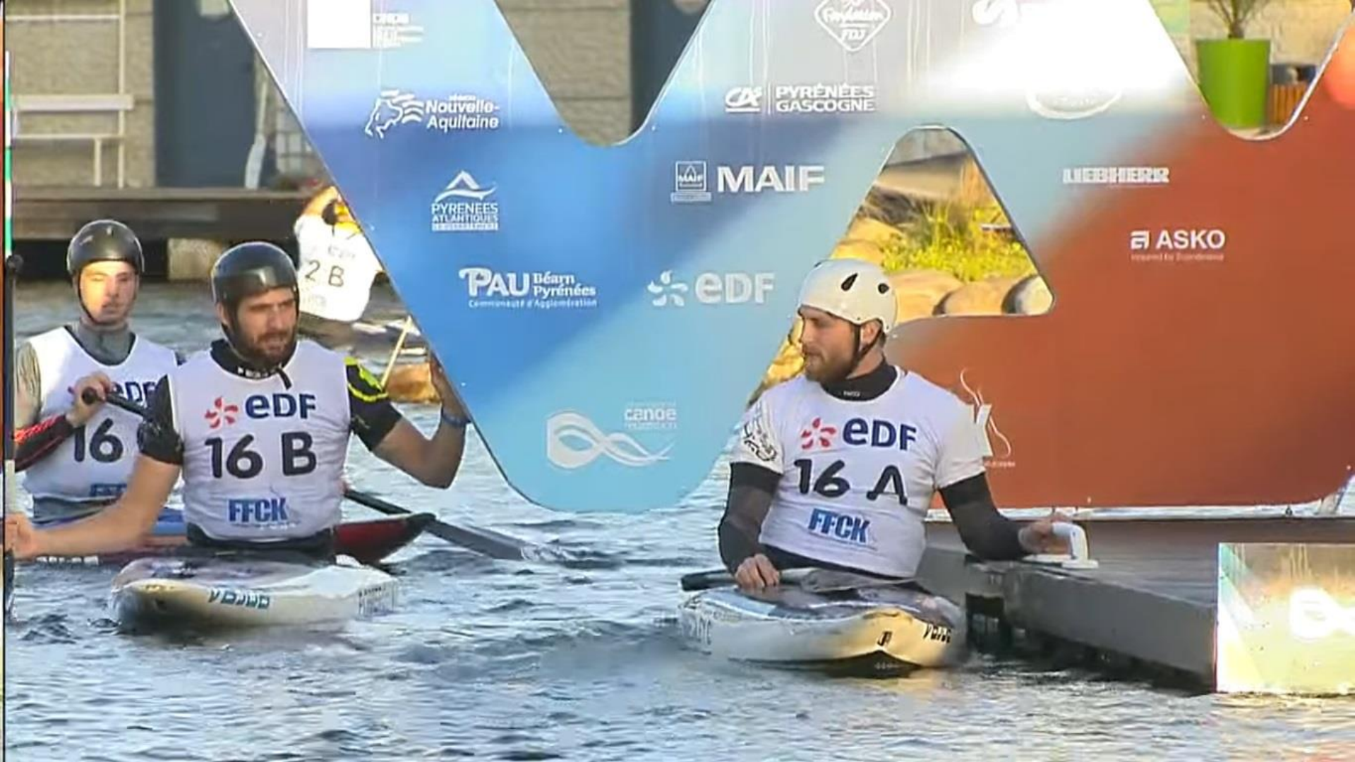
Widok startu w transmisji telewizyjnej - zespoły